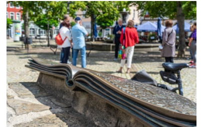
Treffpunkt Historischer Marktplatz – hier beginnen die Öffentlichen Stadtführungen.

Abdruck honorarfrei – die Verwendung der Fotos ist frei für journalistische Zwecke zur Berichterstattung im Zusammenhang mit dem Inhalt der Pressemitteilung bei Nennung der Quelle.