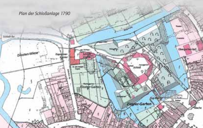
Plan der Schloßanlage 1790

Im Jahre 1661 waren die innere Befestigungsanlage der Stadt