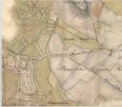
Auszug aus der Generalgrenzkarte von 1771

fertiggestellt und die finanziellen Mittel des Stiftes ausgeschöpft. Die ursprünglich geplante Fortsetzung des Festungsausbaus konnte nicht mehr realisiert werden. Nur noch vergleichsweise bescheidene Bauten, wie das Zeughaus auf dem Schloss, der Pulverturm am gleichnamigen Wall und das als Landesgefängnis vorgesehene Stockhaus wurden bis 1663 errichtet. Von der Stadt finanziert wurde der Bau der Wachthäuser an den Toren und auf dem Marktplatz. Mit der Renovierung der 1612 erbauten katholischen Kirche und dem Neubau des heute als Pfarrhaus genutzten Kapuzinerklosters im 18. Jahrhundert endete die fürstlich hildesheimische Bautätigkeit.