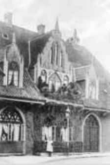
Das Amtmann-Ziegler-Haus um 1910

als auch in der Bevölkerung verhasst. Besonders gefürchtet waren Ziegler's überaus harte Polizeistrafen.