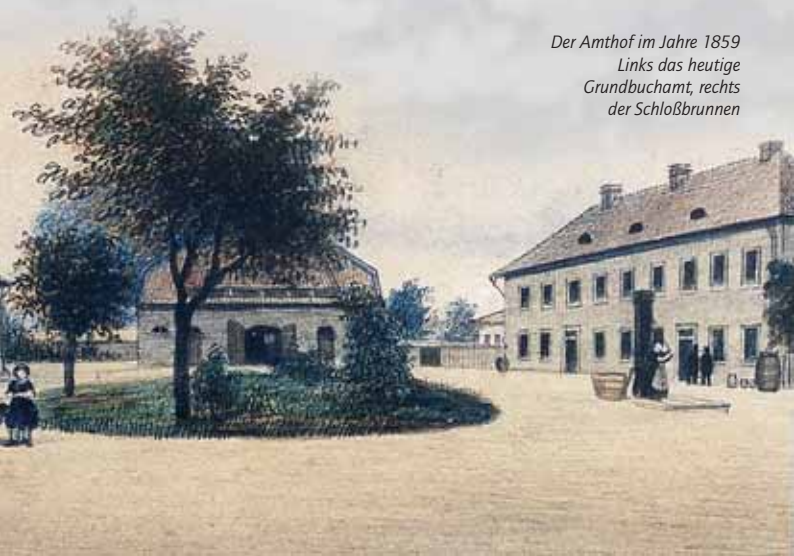
Der Amthof im Jahre 1859 Links das heutige Grundbuchamt, rechts der Schloßbrunnen

Neue Baumaßnahmen wurden erst wieder in preußischer Zeit nach 1866 durchgeführt. So wurde die neue katholische Kirche im Jahre 1868 eingeweiht.