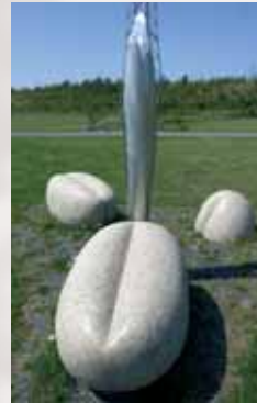
Weizenkörner in Phasen der Keimung