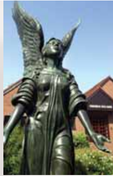
Bronze-Engel vor dem Spee-Haus