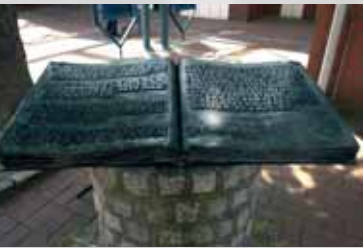
Bronzebuch im Winkel