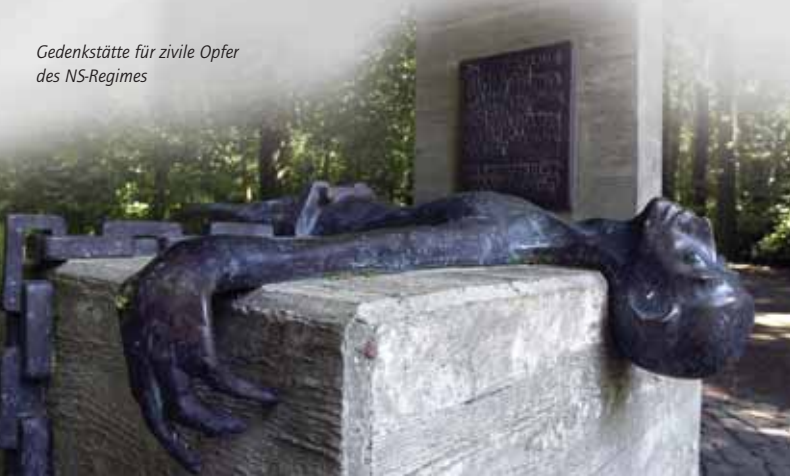
Gedenkstätte für zivile Opfer des NS-Regimes

Inschriften: Eine Tafel zitiert die allgemeine Erklärung der Menschenrechte der Vereinten Nationen: „ Alle Menschen sind frei und gleich an Würde und Rechten geboren “, sowie ein Auszug aus