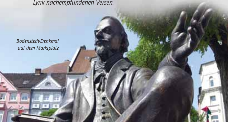
Bodenstedt-Denkmal auf dem Marktplatz

Herausragende Leistungen zeigte er als Übersetzer: seine Übertragungen machten russische Schriftsteller wie z.B. Puschkin und Turgenjew zuerst in Deutschland bekannt; darüber hinaus übersetzte er auch Shakespeare und andere englische Dramatiker. Berühmtheit erlangte der zu Lebzeiten international populäre Schriftsteller insbesondere durch ein Werk: „Die Lieder des Mirza Schaffy“ (1851), eine Sammlung von orientalischer Lyrik nachempfundenen Versen.