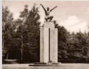
Der „Hockende“ im Herzberg um das Jahr 1930

Die stark beschädigte Figur wurde auf Kosten der Stadt wieder hergerichtet und dem Volkswang-