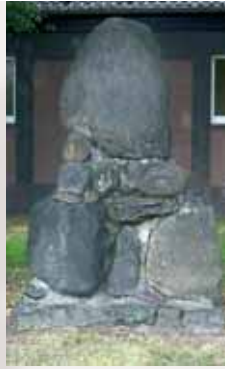
Gedenkstein 1813 am Schützenplatz

Das 100 jährige Jubiläum der Völkerschlacht wurde 1913 als nationaler Feiertag begangen.