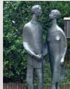
„Begegnung“ in der Schützenstraße