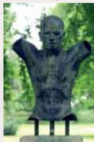
„Torso“ im Stadtpark