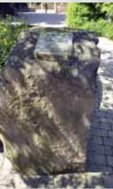
„Wilhelmstein“ im Winkel