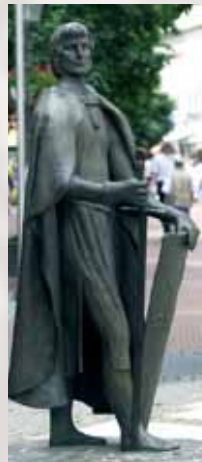
Gunzelin an der Ecke Gröpern/Schützenstraße