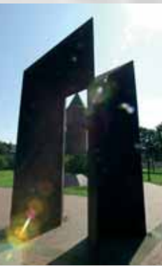
Durch und durch und durch und durch

Dreiteilige Stahlblech-Skulptur: zwei Pyramiden-Stümpfe und ein 4 Meter hohes, 1 Meter breites und 8 Tonnen schweres Tor;