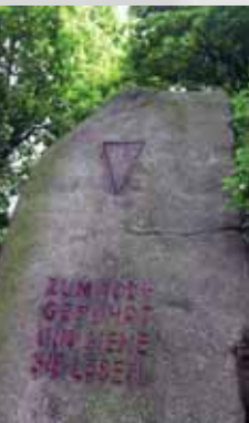
Gedenkstein für die Opfer des Nazi-Terrors