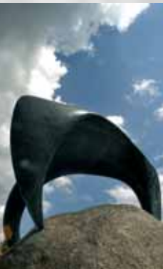
„Die Kralle“ vor dem Gymnasium am Silberkamp