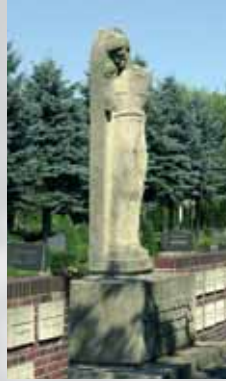
Ehrenruhestätte Friedhof Telgte