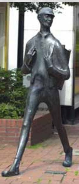
Schicke-Schacke auf dem Echternplatz

Nach mehreren Schändungen des Gedenksteines fand am 25. November 1951 eine Neueinweihung statt.