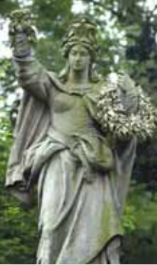
„Germania“ an der Sedanstraße